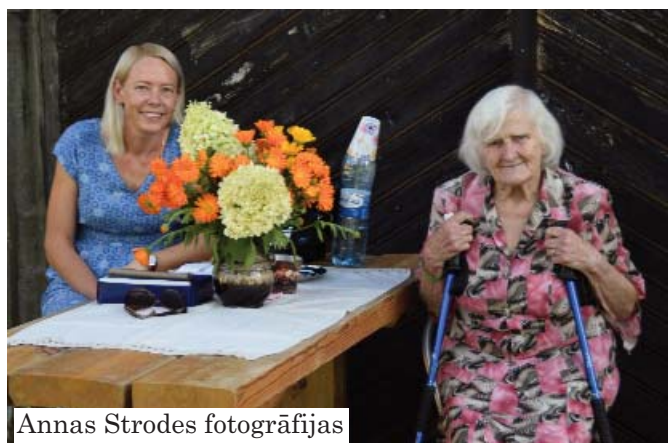
Annas Strodes fotogrāfijas