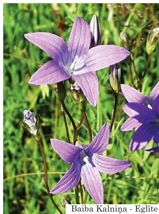
Baiba Kalniņa - Eglīte