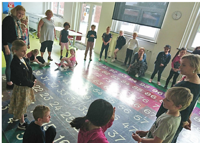
Piedalāmies 3. klases stundā.