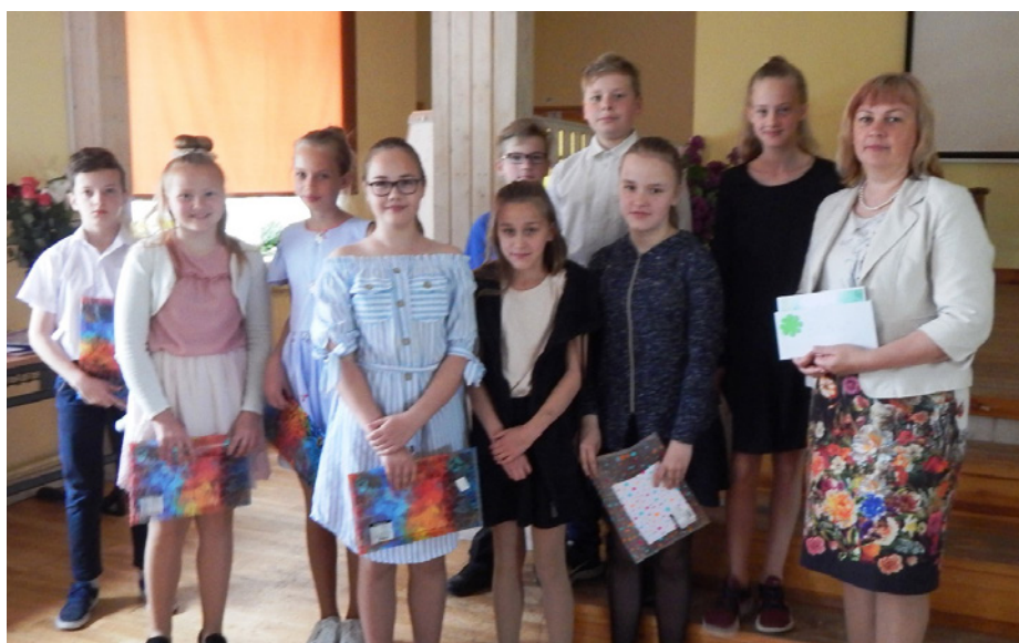
Veiksmīgākie makulatūras vācēji – 5.klase.

Par savākto un “ZAAO” nodoto makulatūru balvās tika saņemtas dāvanu kartes 60 EUR apmērā kancelejas preču iegādei.