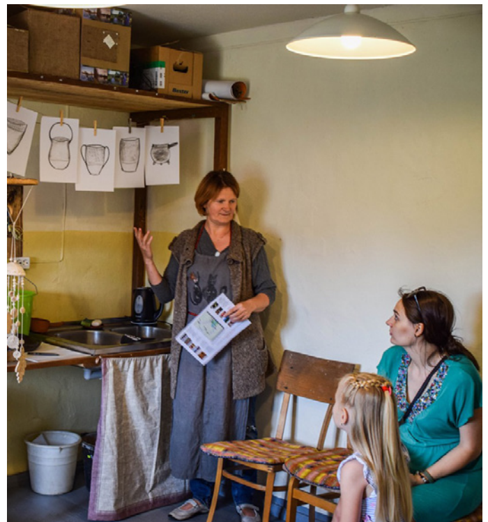
Keramikas darbnīcā “Marikas darbi”.