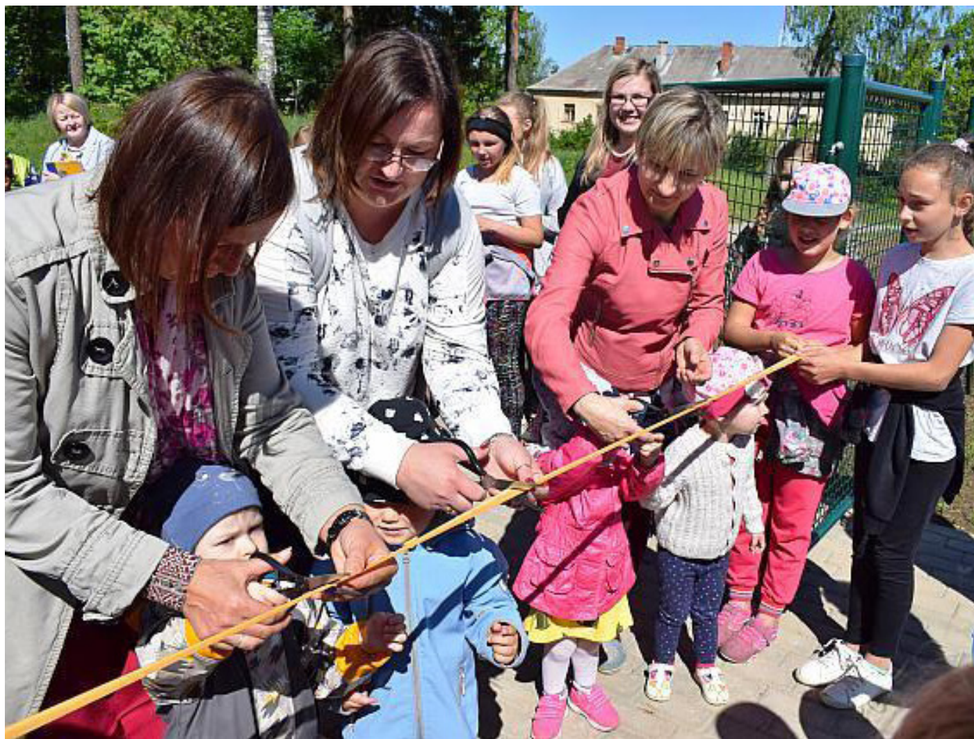
Sporta un atpūtas laukuma atklāšana Jaunpiebalgā.