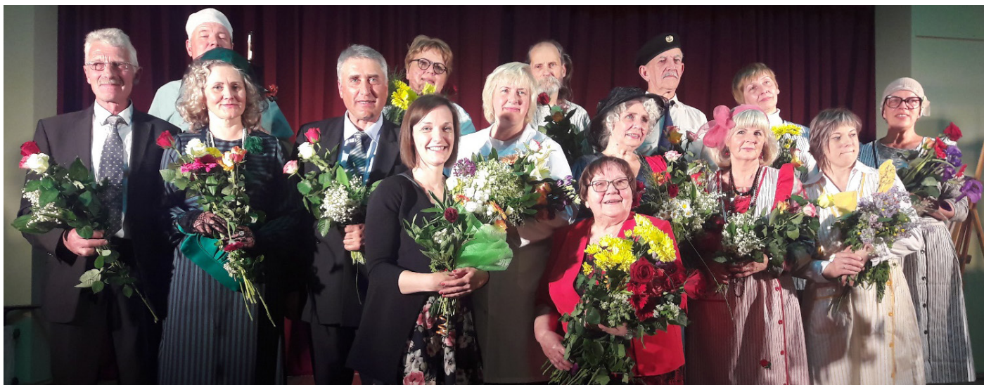
Amatierteātris "Triksteri" pēc lugas "Dīvainā mīsis Sevidža" izrādīšanas.