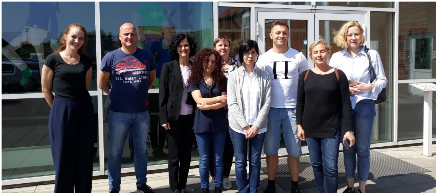
Visa ERASMUS+ "4C" Dānijas aktivitātes komanda.

Projektā piedalās komandas no 5 valstīm: Latvijas, Dānijas, Itālijas, Portugāles un Anglijas (šoreiz neieradās).