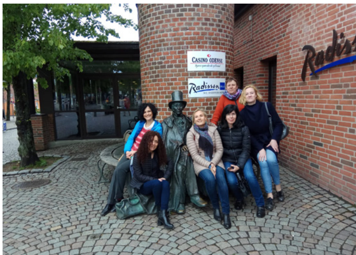
Komandas poze pie Andersena skulptūras.