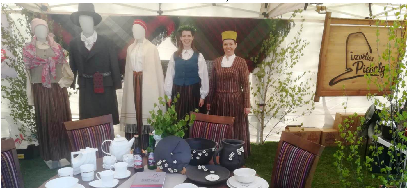
Vidzemes Uzņēmēju dienās Valmierā Jaunpiebalgas un Vecpiebalgas novadi piedalījās kopā.

Šī gada 17. - 18. maijā Valmierā 22. reizi norisinājās "Vidzemes Uzņēmēju dienas 2019", ko organizē Latvijas lielākā uzņēmēju biedrība Latvijas Tirdzniecības un rūpniecības kamera (LTRK). Tās kļuvušas par gaidītu pasākumu, pulcējot katru gadu arvien lielāku dalībnieku un apmeklētāju skaitu. Piedaloties izstādē, uzņēmējiem ir iespēja ar savu produkciju un pakalpojumiem iepazīstināt vairākus tūkstošus reģiona, citu Latvijas novadu, kā arī ārvalstu viesus.