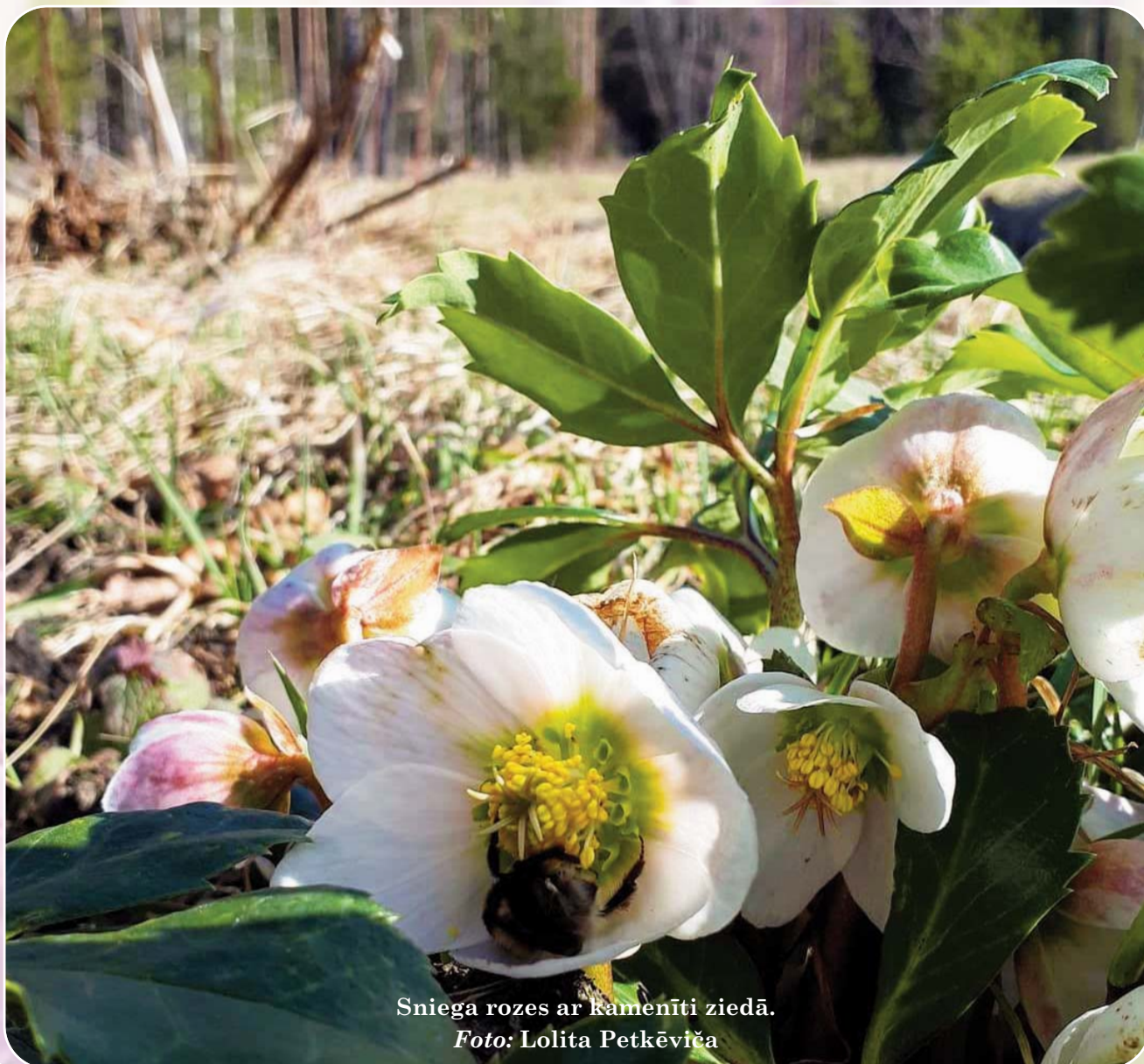
Sniega rozēs ar kamenīti ziedā.