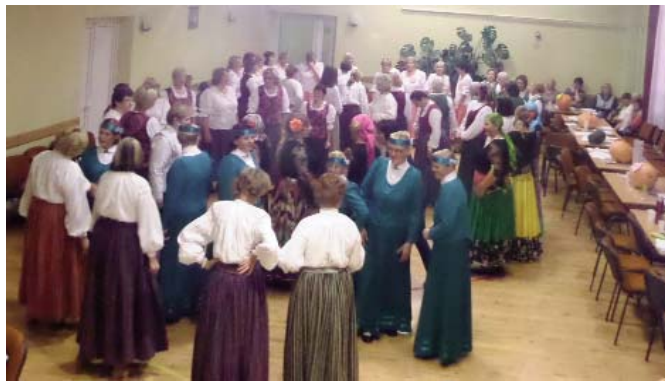
Attēlā: koncertā bija pārstāvēti astoņi pagasti no šiem novadiem.