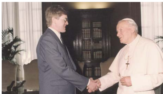
Attēlā: tikšanās ar Romas pāvestu Jaņi Pāvilu II.