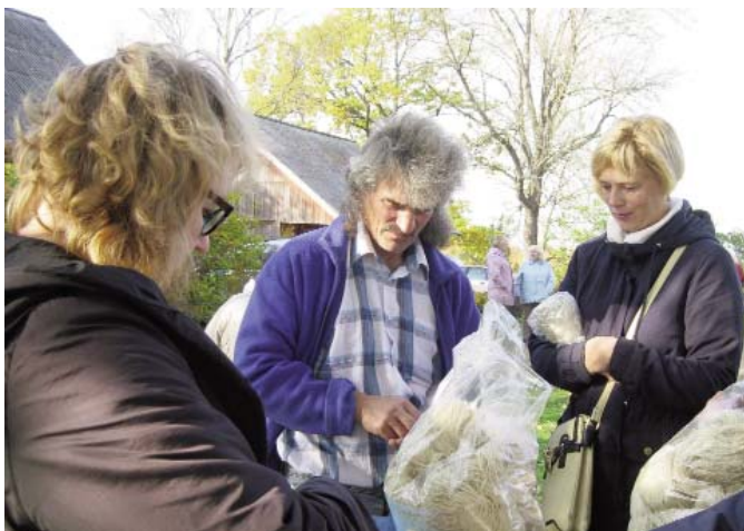
Attēlā: zemnieku saimniecībā "Mazvieķi".

Tieši tādēļ, kad beidzas ikdienas darbi un vasaras steiga, esam apņēmības pilni un nākam kopā, lai, uzsākot jauno sezonu, sajustu drauga plecu, ļautos kolektīviem smiekliem un piedzīvojumiem, kurus sākām krāt jau to vakar. Deju kopā "Vēlais pilādzis" skaita ziņā ir maza, taču dāmas ir drošas, enerģiskas un izdomas bagātas.