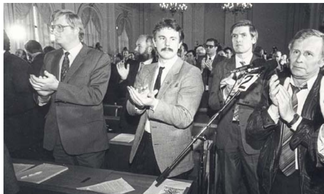
Attēlā: Latvijas PSR Augstākās Padomes Deklarācijas parakstīšana par Latvijas Republikas neatkarības atjaunošanu 1990. gada 4. maijā.