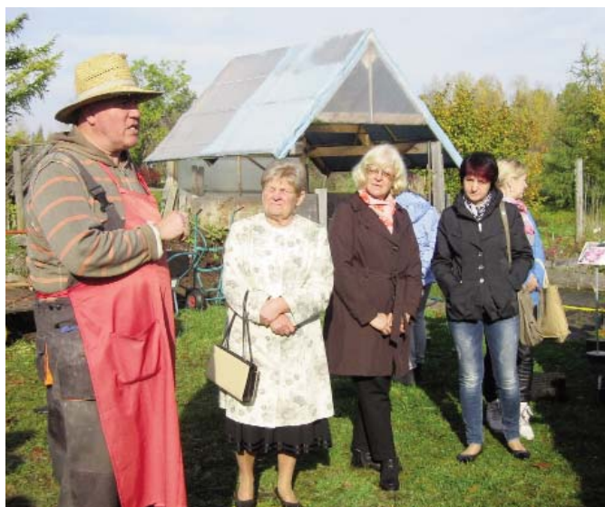
Attēlā: "Vidzemes ceriņi" Zosēnu zeme, z/s "Stādaudzētava".

Dejot - tas nozīmē kopt prieku. Ja runājam par sievietēm, viņām visvairāk ir nepieciešams dejot, jo tās ir aktīvākas nekā vīrieši. Dejā šo enerģiju var rast un realizēt. Protams, ir dažādi iemesli, kāpēc cilvēks nāk dejot. Ne vienmēr tas ir tikai sevis harmonizēšanai.