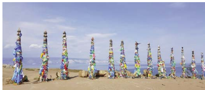
Attēlā: ...liecība par šamanismu.