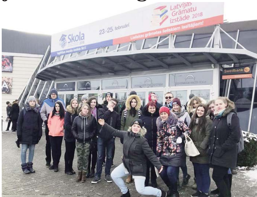
Attēlā: karjeras dienā Rīgā.