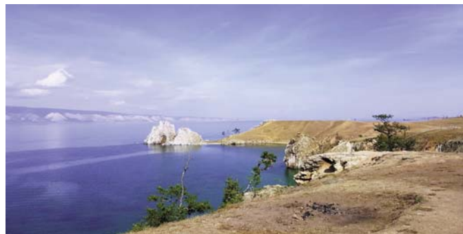
Attēlā: Olhonas salas skaistums.

Rasma: Olhonas salā kādā ciematiņā ir tāds kā iepirkšanās centrs tūristiem, bijām izslāpuši pēc kafijas (Krievijā dabūt labu kafiju ir ļoti grūti), mums kāds puisis sataisīja kafiju, stāstījām, ka esam no Latvijas, un viņš mums pateica skaistā latviešu valodā vismaz 2 frāzes, izrādās, pēdējā laikā te parādās vairāk latviešu.