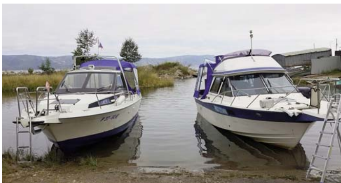
Attēlā: ātrgaitas kuteri.