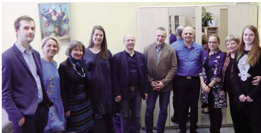
Attēlā: vieskolotāji Karjeras dienā vidusskolā.