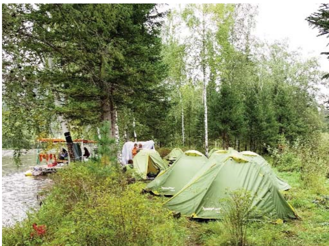
Attēlā: mūsu pirmā nakts - nakšņošana taigā.

Pēc pilsētas apskates, vairākas stundas braucot kalnos ar autobusu, nonācām Listvjankā. Īpašs un neaizmirstams bija brauciens ar plostu pa upi un nakšņošana taigā. Jāpiebilst, ka mūsu ceļojuma laiks bija labvēlīgs arī tādā ziņā, ka augusta beigās taigā vairs nav tādu sīku mušiņu, kuras nejauki kož un pēc tam āda niez, lai gan tomēr man kāda pamanījās iekost. Kad jau bijām Baikālā, tad uzzinājām, ka mūsu telšu vietā esot pamatīgi plosījušies lāči.