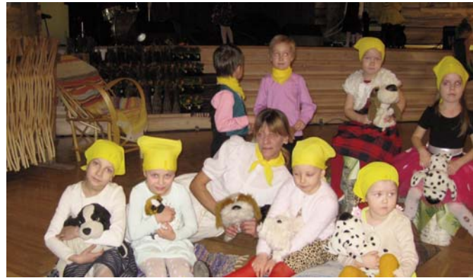
Attēlā: mazie Zosēnu dejotāji koncertā “Cālis 2017”.