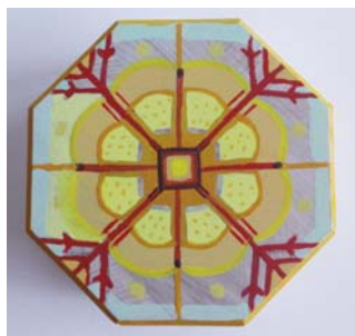
Attēlos: Saules zīmes - koka apgleznošanas darbnīca „Gaismas zīme sev un savai mājai” - Rasa Ontužāne.