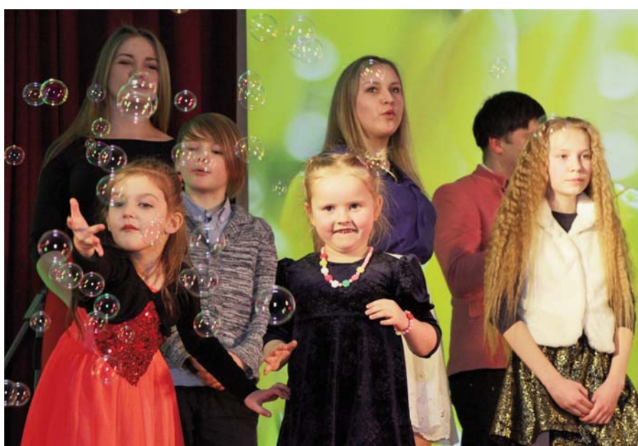
Attēlos: daži mirkļi no koncerta “Mēs tiksimies martā”.