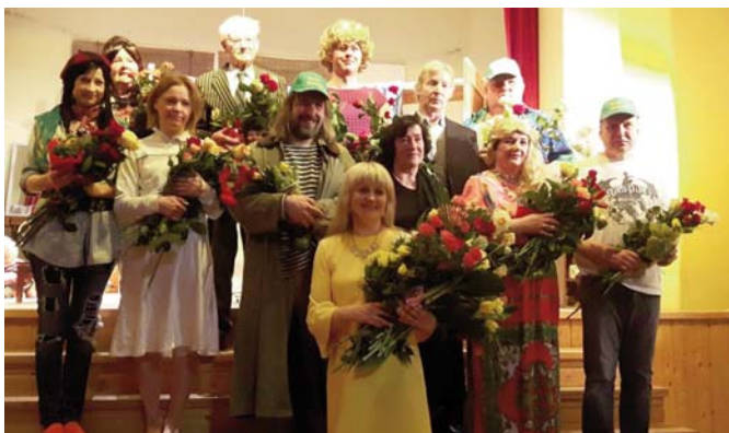
Attēlā: Zosēnu amatiereteātra “Intermēdija” dalībnieki pirmizrādes vakarā.