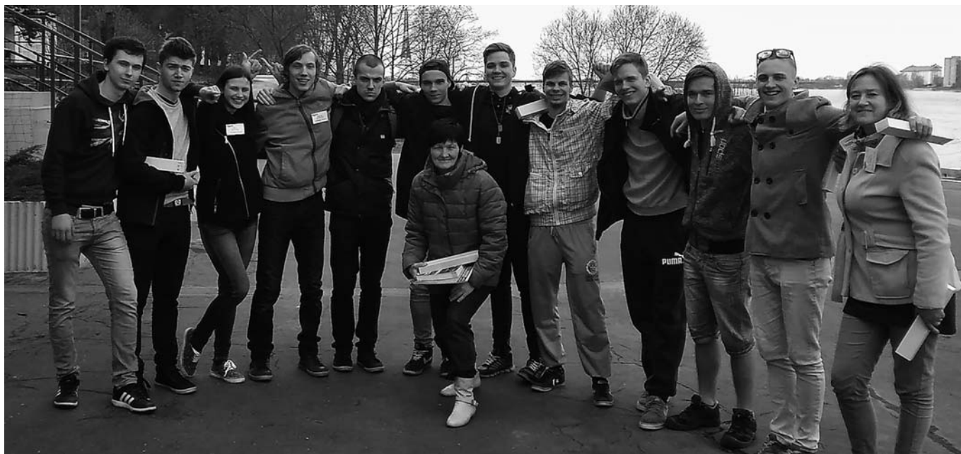
Attēlā: konkursa “Enkurs -2016” pusfināla dalībnieki.