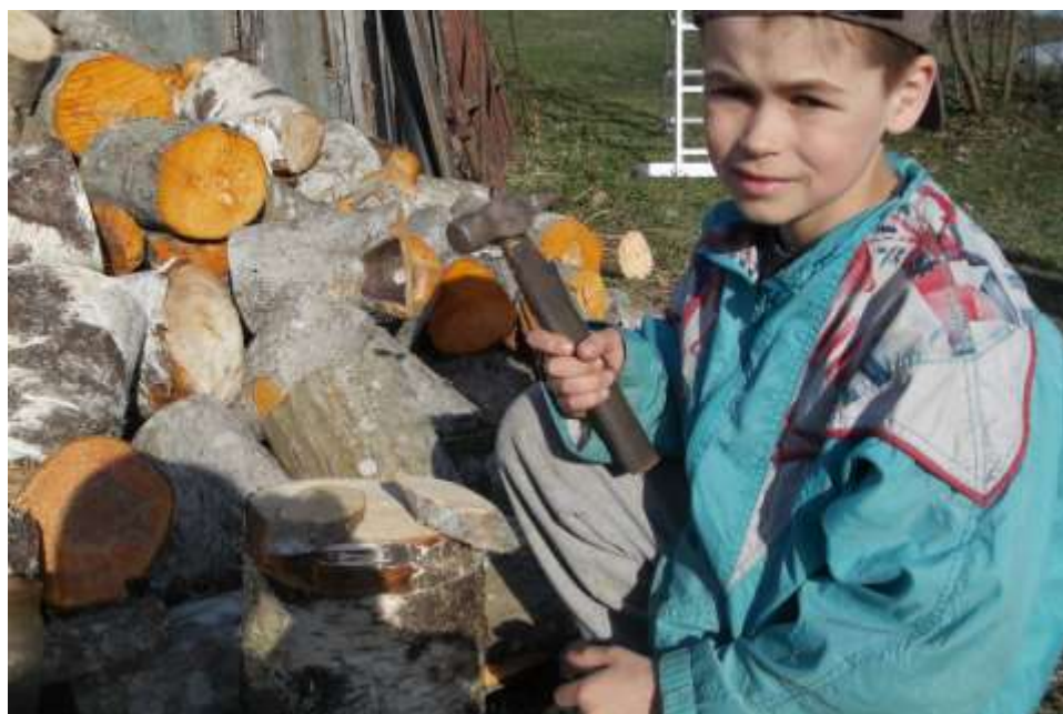
koka ripu sagatavošana