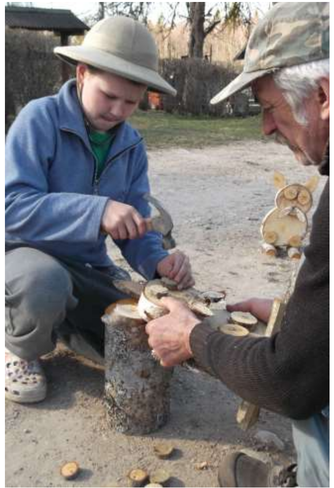
zaķis gandrīz gatavs