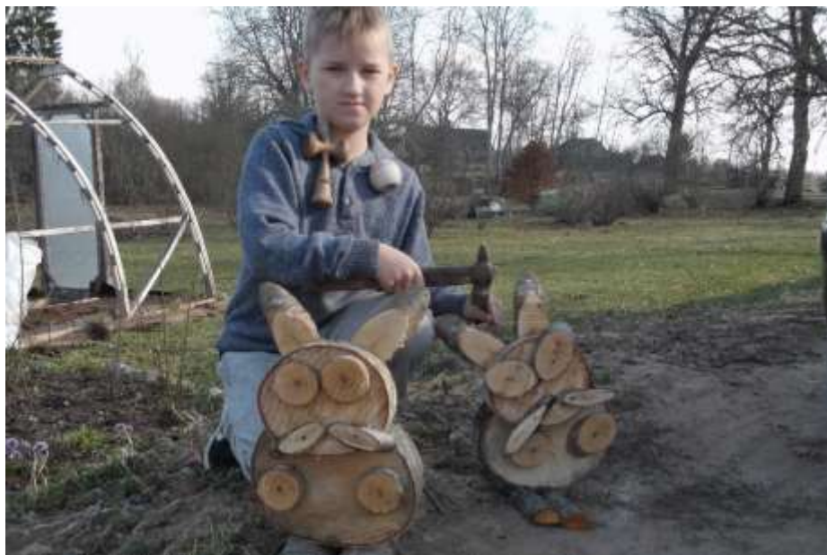
Lieldienu zaķu gatavošana

17. 04. - radošā darbnīca – gatavojam Lieldienu zaķus