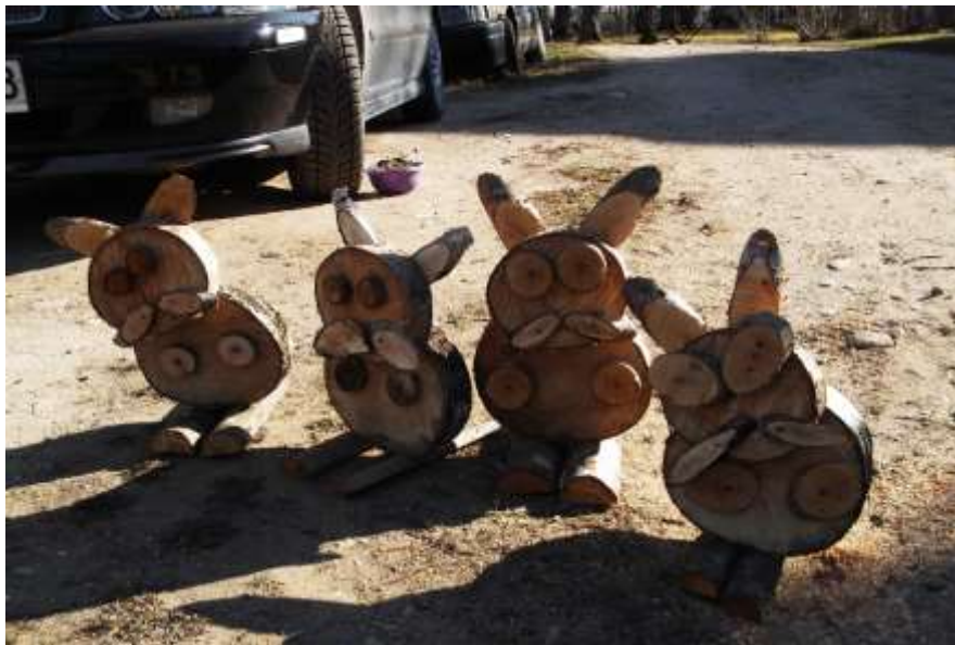
zaķi ceļo uz bibliotēku svinēt Lieldienas